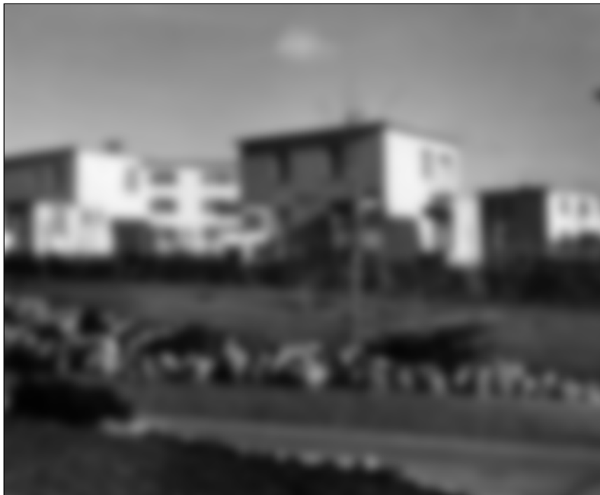
Baťovské ambulatorium s okolní obytnou zástavbou ve Zručí nad Sázavou na nedatované fotografii nejspíše z roku 1947.