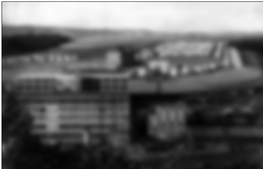
Tovární areál, společenské a obytné zázemí národního podniku Baťa, Zlín, závodu Zruč nad Sázavou, na fotografii z roku 1946.

výhodná poloha v rámci železniční sítě a blízkost silného vodního toku. 823 Neméně významným motivem byla i poloha Zruče nad Sázavou nedaleko křížení projektované železniční a silniční magistrály, jež byla Baťovým koncernem nejen plánována, ale i detailně vyobrazena v publikaci Budujeme stát pro 40 000 000 lidí (1938). Poloha Zruče právě v tomto projektu saturovala jak absenci klíčového silničního spojení, tak významného železničního uzlu (Posázavská dráha z Čerčan do Světlé nad Sázavou s odbočkou do Kutné Hory je napojena na železniční trať Praha–Brno až ve Světlé nad Sázavou). 824