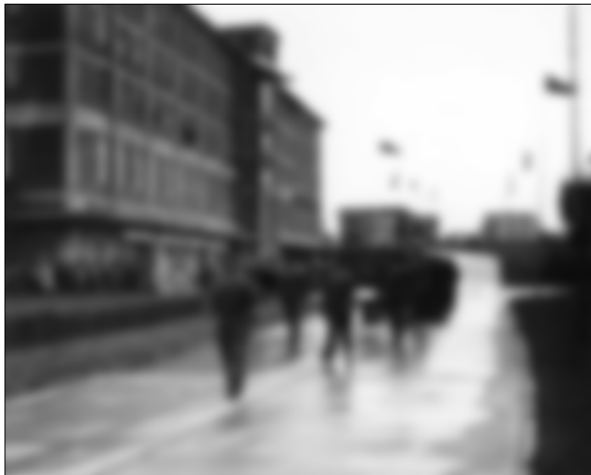
Poválečné oslavy v baťovské Zručí nad Sázavou na nedatované fotografii z druhé poloviny čtyřicátých let 20. století.

centralizace poválečného československého školství. 934 Nahradit ji měla ve školním roce 1946/1947 večerní Osvětová škola pro mládež, v níž probíhala výuka národohospodářství, základů zdravotvědy, etiky a sociologie, dějepisu, literatury a politické výchovy. 935 Alternativou bylo i otevření exportní školy Baťových závodů ve Zlíně pro absolventy BŠP nebo žáky čtvrtých ročníků měšťanských škol s pětiletou praxí v Baťových závodech. 936