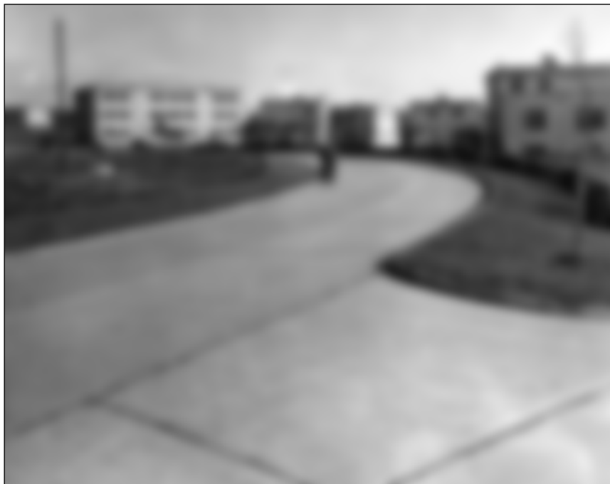
Baťovská obytná čtvrť na nedatované fotografii nejspíše z roku 1947.

E. Hruška projektoval svobodárny, sídelní kapacitu baťovské Zruče rozšířil na 12 000 osob a její zástavbu protáhnul až na vrchol nad městem. V několika variantách Hruškova regulačního plánu byla zapracována řada veřejných budov, nemocnice, školy, kulturní zařízení a stadion. Změněná infrastruktura vycházela vstříc rostoucím požadavkům automobilismu. Především však již Hruškova koncepce nemultiplikovala vzorec ideálního průmyslového města, ale respektovala místní podmínky v nesnadných protektorátních časech. Podle Hruškovy makety z roku 1944, vystavené v roce 1949 u příležitosti 10. výročí založení baťovské Zruče nad Sázavou, byl naproti Společenskému domu projektován kulturní dům s biografem, v dolní části náměstí obchodní dům s lázněmi v suterénu a v horní části náměstí park s (Baťovým?) pomníkem. Podle tohoto Hruškova modelu sice nebyla postavena žádná budova, ústupky říšskoněmeckým a protektorátním urbanistům (valbové střechy, přízemní průjezdy, omítnuté zdivo se šambránami kolem oken) však stylově připomíná dokončená fasáda Společenského domu. 885