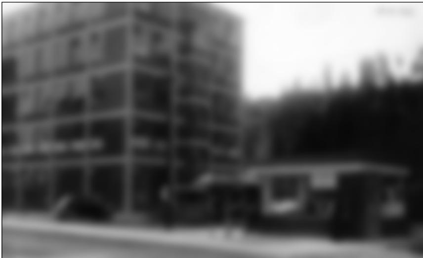
Vrátnice a vstupní partie výrobního areálu Baťa, a. s., Zruč nad Sázavou, na fotografii z 29. 8. 1940.

a řeky Sázavy, 838 kámen z původně obecního kamenolomu, firmou rovněž zakoupeného, cement z cementárny na louce před továrnou a cihly z dvanáctikomorové cihelny, zprovozněné na jaře 1940 za nádražím na louce táhnoucí se směrem k Domahoři. 839 Jen v roce 1940 cihelna vyprodukovala s 27 dělníky 1 500 000 cihel strojových a 120 000 cihel ručních a její provoz byl uzavřen až v dubnu 1942. Její zaměstnanci byli posláni za nucenou práci do Říše. Více než tři stovky stavebních dělníků, pracujících paralelně na výstavbě nejstarších obytných domů, byly za korunu denně ubytovány v dřevěných barácích, 840 v srpnu 1939 vybavených i kuchyní, jídelnou a restaurací. 841