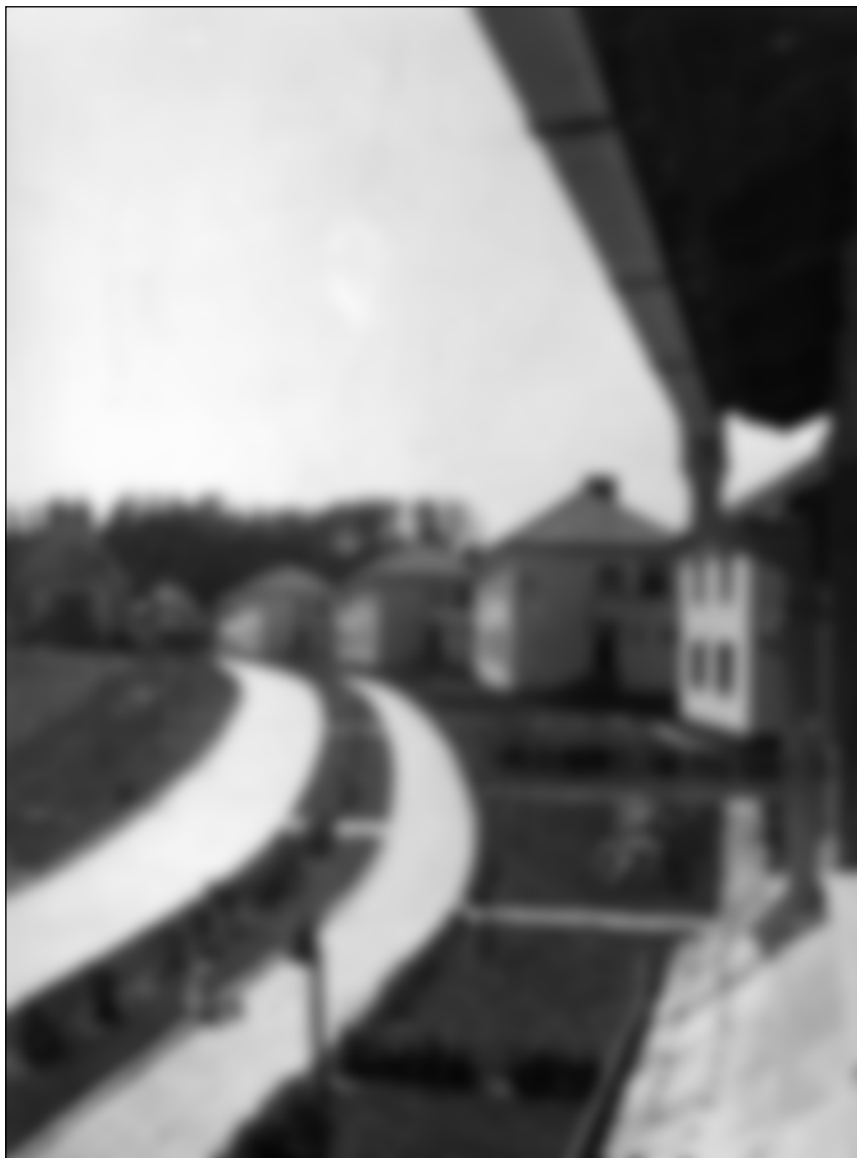
Obytná zástavba národního podniku Baťa, Zlín, ve Zručí nad Sázavou na fotografii z roku 1947.